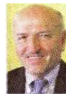
Qui sopra, Giorgio Merletti , presidente di Confartigianato